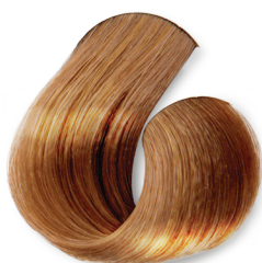
Louro Muito Claro Marrom Dourado Suave