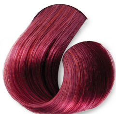
Louro Escuro Vermelho Intenso