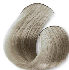
Louro Claríssimo Pérola Suave