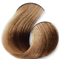
Louro Muito Claro Bege Dourado Suave