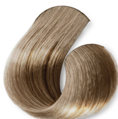
Louro Muito Claro Bege Acinzentado