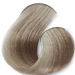
Louro Muito Claro Pérola