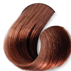
Louro Claro Cobre Intenso