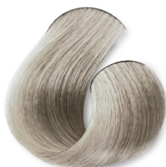
Louro Ultra Claro Pérola (Champagne)