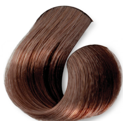
Louro Escuro Dourado Acobreado (Canela)