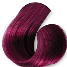
Louro Claro Violeta Avermelhado (Marsala)