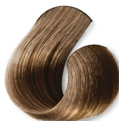
Louro Muito Claro Bege Dourado (Folha Seca)