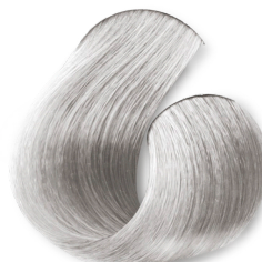
Louro Ultra Claro Cinza Profundo