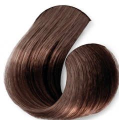
Louro Escuro Cobre Acinzentado (Toffee)