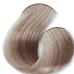
Louro Claríssimo Irisado Acinzentado Suave