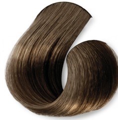
Louro Médio Intenso Marrom Acinzentado