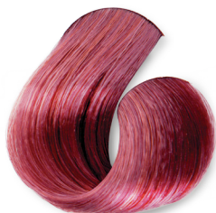
Louro Claro Vermelho Intenso