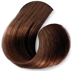
Louro Escuro Marrom Acaju (Canela Intenso)