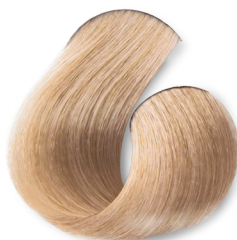
Louro Muito Claro